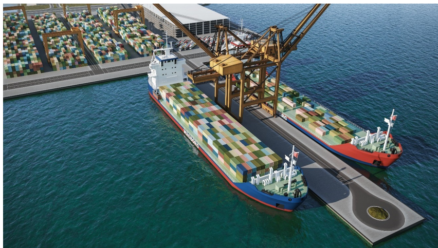
Απεικόνιση λιμενικών υποδομών

Απεικόνιση της Αποθήκης 4 με την, εξέχουσας σημασίας γέφυρα, που θα ενώνει το θαλάσσιο μέτωπο (λιμάνι) με τη σιδηροδρομική γραμμή και όλο το Πάρκο.