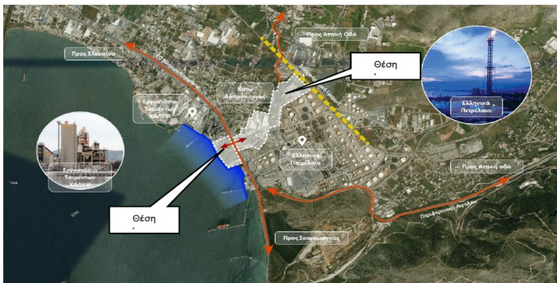
Θέση της επένδυσης – Ασπρόπυργος Αττικής

Η περιοχή επέμβασης έχει επιφάνεια 291 στρέμματα και βρίσκεται εντός της ΒΙ.ΠΕ. Διυλιστηρίων, στο 17 ο χλμ. της Ε.Ο. Αθηνών-Κορίνθου. Η έκταση διαχωρίζεται από την Ε.Ο. Αθηνών-Κορίνθου σε δύο τμήματα, τμήμα Α (238 στρέμματα) και τμήμα Β, παραλιακό (53 στρέμματα). Τα δύο τμήματα θα συνδέονται μεταξύ τους με γέφυρα, που θα κατασκευαστεί. Η έκταση έχει μέτωπο στον κόλπο της Ελευσίνας, όπου θα κατασκευαστεί προβλήτας πρόσδεσης πλοίων, με τα αντίστοιχα λιμενικά έργα και τις απαραίτητες υποδομές για την φορτοεκφόρτωση εμπορευματοκιβωτίων μέσω θαλάσσης. Επίσης, στα βόρεια, η έκταση συνορεύει με τη σιδηροδρομική γραμμή Θριάσιο-Νέο Ικόνιο, ήτοι με το εθνικό σιδηροδρομικό δίκτυο, μέσω του οποίου θα είναι δυνατή η άμεση μεταφορά εμπορευματοκιβωτίων σε χώρες της Ευρώπης.